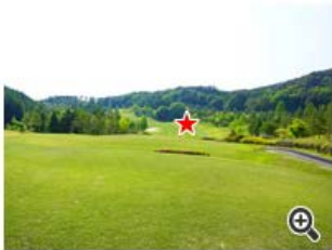
打ち下ろしてバンカー右が狙い。

距離が短めのサービスロングホール。 最短距離を狙うと左OBへ行きやすいので、安全に3オンが賢明です。 もしティショットがバンカー横まで行ければ、2オンを狙いのイーグルも夢じゃない!