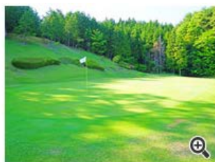
横幅の広いグリーン。