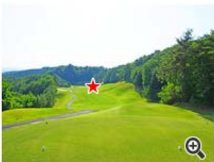
急な打ち下ろしで幅も狭いので、安全に刻むのも手。

距離は短いけど左右OBのミドルホール。ティショットが150~170ヤード付近で平らな場所になる。そこからは残り130~150ヤード程度しかないので安全に。