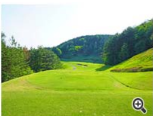
バンカーに引っかけられないよう、番手一つ大き目に。

引っかけた左の谷、プッシュして右の林方向へのOBが多い。センター狙いが安全だが、横長のグリーンなので距離感も大事。打ち下ろしは-5ヤード程度。