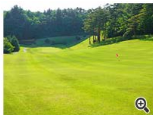
さらに打ち下ろしが続く。左は谷なので右を狙った方が安全。