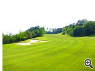
ティショットで距離を稼いだら、2オンを狙おう!